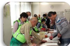
災害ボランティアコーディネーター養成講座