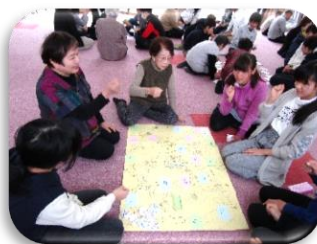
ふれあい・いきいきサロン