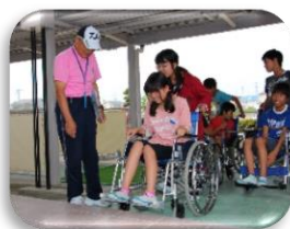
市内小中学校の福祉学習支援