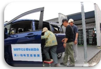
買い物等支援事業