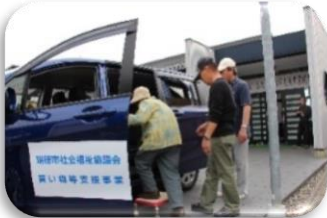
買い物等支援事業