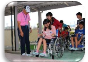
市内小中学校の福祉学習支援