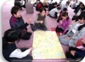
ふれあい・いきいきサロン