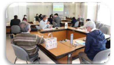
ボランティア講座