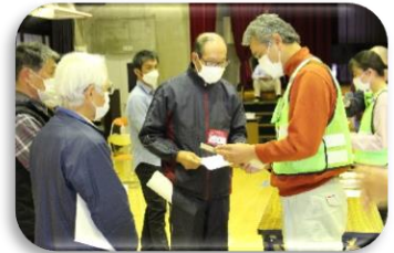
災害ボランティアの推進