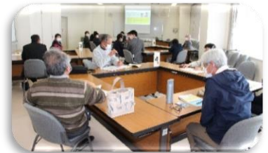
ボランティア講座