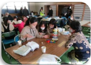
ふれあい・いきいきサロン