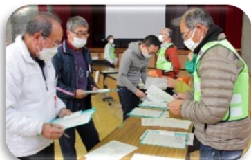
災害ボランティアセンター設置運営訓練 （災害ボランティアコーディネーター養成講座にて）