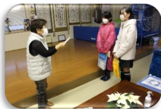
福祉共育（高齢者宅訪問）