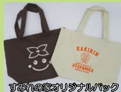
すみれの家オリジナルバック