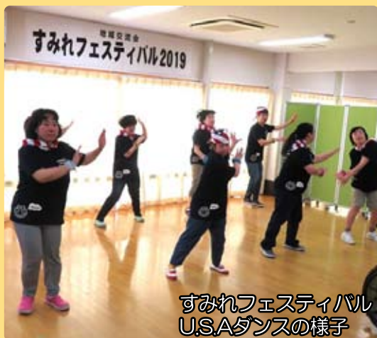
すみれフェスティバル U.S.Aダンスの様子