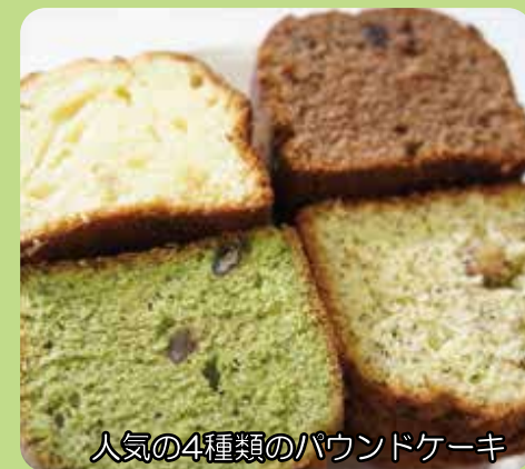
人気の4種類のパウンドケーキ