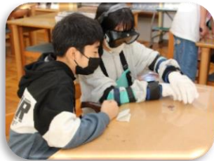
福祉共育（高齢者疑似体験）