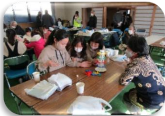
ふれあい・いきいきサロン