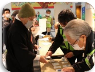
災害ボランティアセンター設置運営訓練