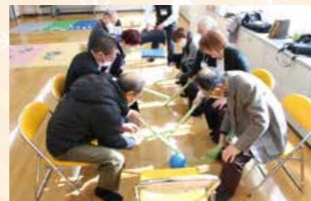
体験会のようす (ベンチホッケー)