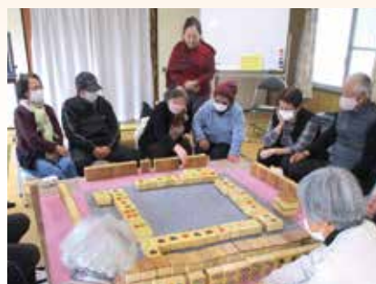
コミュニケーション麻雀を楽しんでいるようす