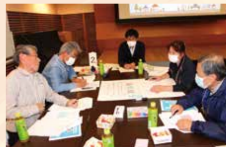
グループワークのようす

また、令和8年1月は、介護予防レクリエーション体験会を行いました。(関連ページ 8ページ)