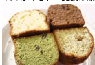
▲すみれの家 パウンドケーキ