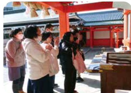
作法にならって、神社へお参りしました。

豊住園、すみれの家では、様々な商品を作り販売しています。販売商品の詳細につきましては、本会のホームページ ( https://www.mizuho-shakyo.org ) にカタログを掲載しておりますので、ご覧いただくか、各作業所までお問い合わせください。