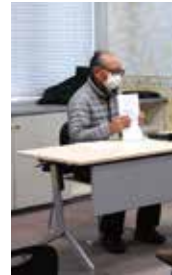
事例発表のようす

後半は、介護予防レクリエーション体験会として、家庭用ゲーム機を使ったレクリエーションと、本会が用意した2種類の簡単なレクリエーションをしました。どちらのレクリエーションも、とても盛り上がっていました。また、「自分の地域に取り入れたい。」と話すかたもみられ、身近で簡単なレクリエーションを通して、地域の集まりがより一層楽しくなればと思います。