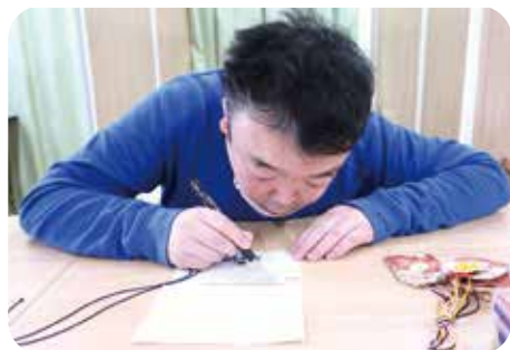
今年頑張りたいことを紙に書いて、お守りの中に納めました。

体験学習は、普段の作業所内の活動だけでは学べないことを、楽しみながら利用者に学んでもらう機会として、とても大切な行事です。