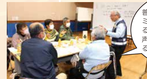
地域支え合い推進会議 テーマ：防災と地域のつながり

普段から近所の人とコミュニケーションを取ることによって、避難時にも声を掛け合ったりできるね。