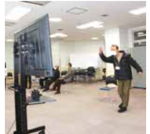
家庭用ゲーム機でボウリング