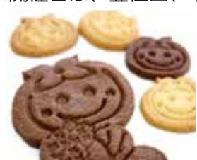
▲豊住園 かきりんクッキー