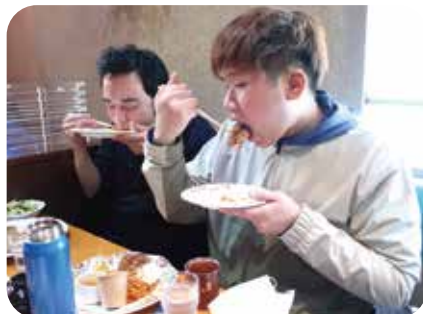
マナーを守って、おいしい昼食をいただきました。