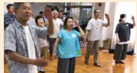
楽しくなくっちゃ 生津じゃない!

生津 de ダンス~地域で集まることから始めよう~ 盆踊りやオリジナルダンスを通して、世代を超えた交流が生まれ、生津らしいあたたかなつながりが広がっています。