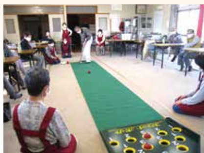
スカットボールに挑戦しているようす